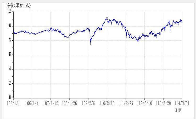
--- 復華新興債股動力組合基金-新臺幣